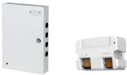
Netzgeräte und Stromkästen

Weitere Produkte finden Sie auf www.nsc-videotechnik.de