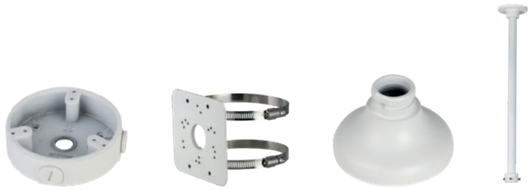
Halterungen für Überwachungskameras