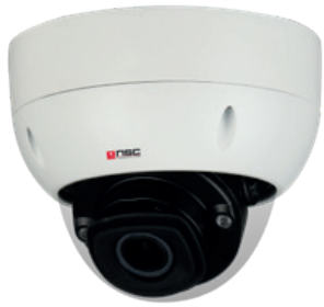
IP Dome Kamera NI-DM98Z