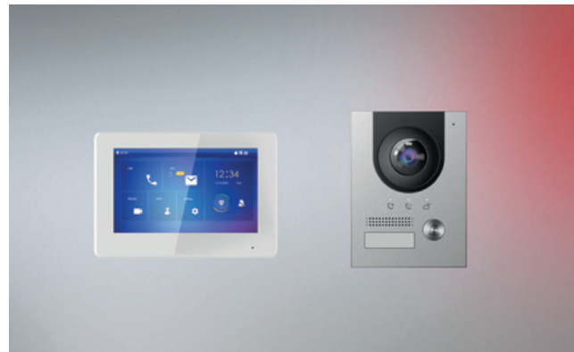
IP Video Türsprechanlagen